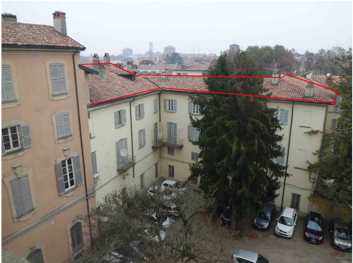
Individuazione della porzione di copertura del volume verso corte