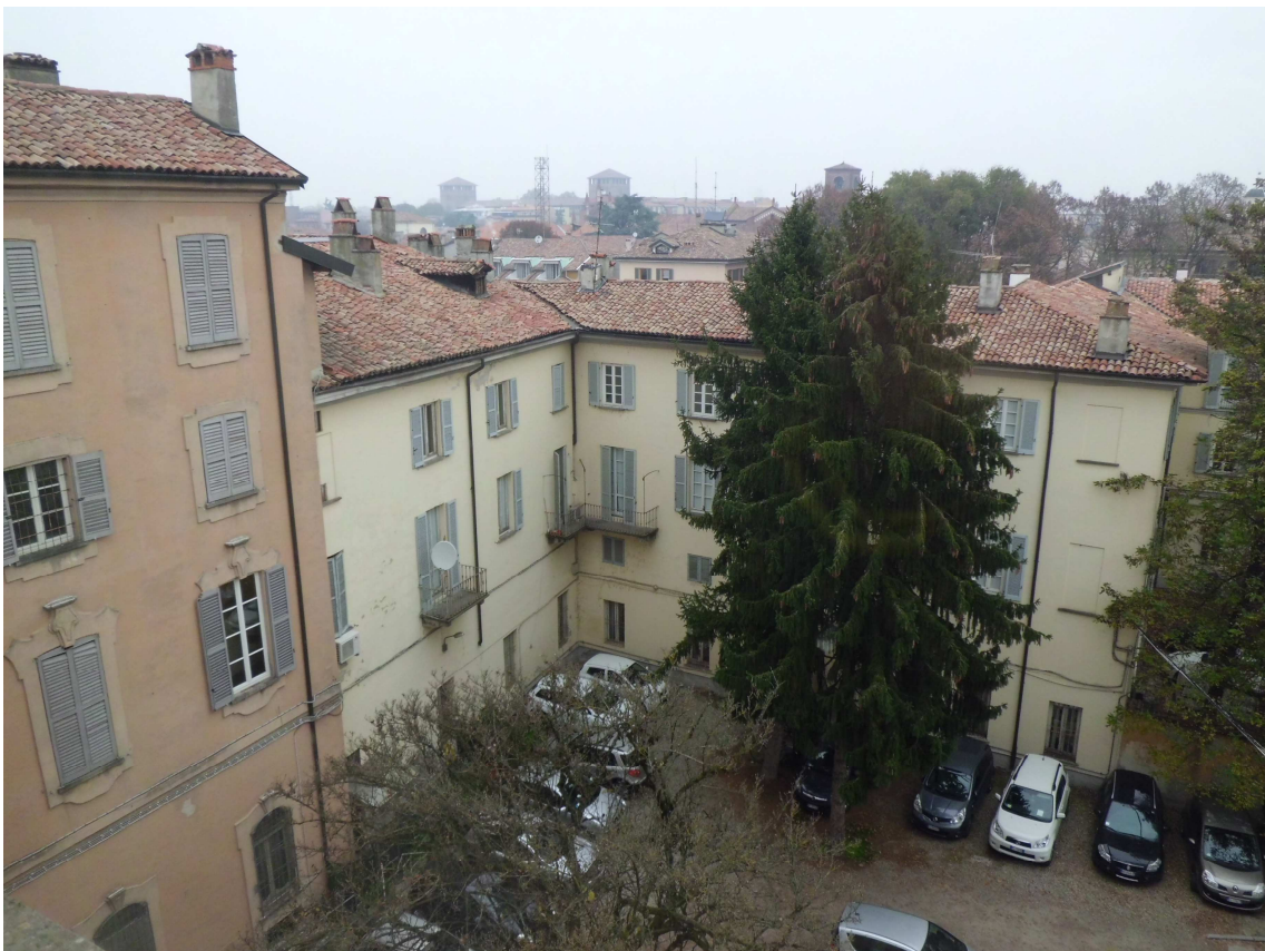
Vedute del corpo di fabbrica verso la corte interna