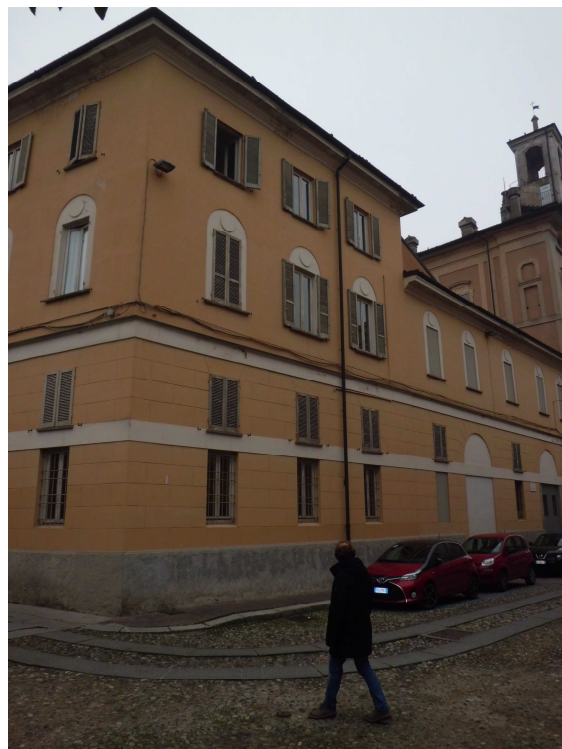
Veduta dei corpi di fabbrica prospicienti via Foro Magno