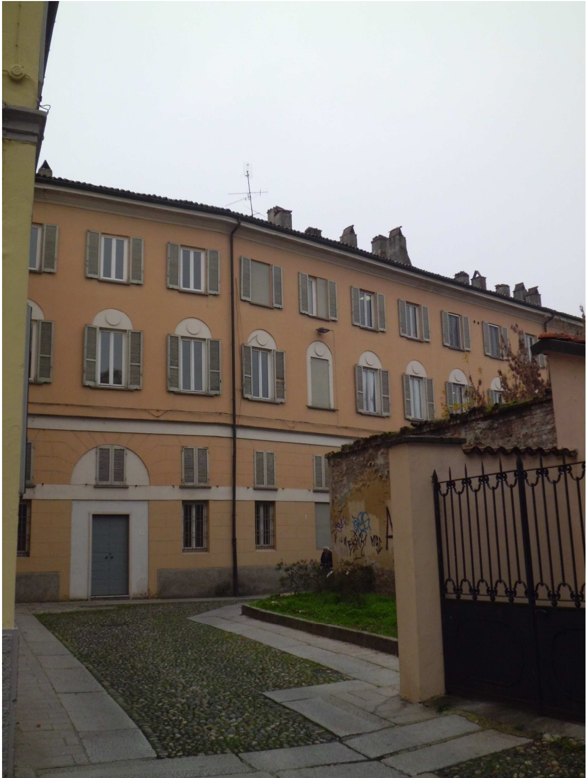
Veduta del corpo di fabbrica prospiciente via Foro Magno