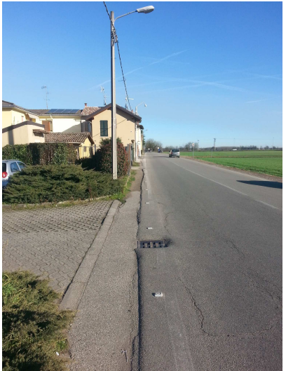
Foto della banchina esistente da ovest ad est.