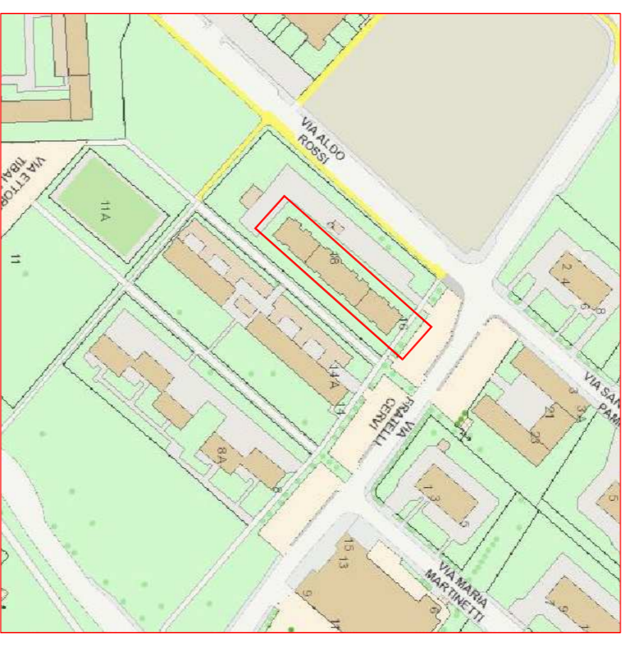
ESTRATTO CARTOGRAFIA Sistema Informativo Territoriale del COMUNE DI PAVIA Individuazione dell'ambito di intervento