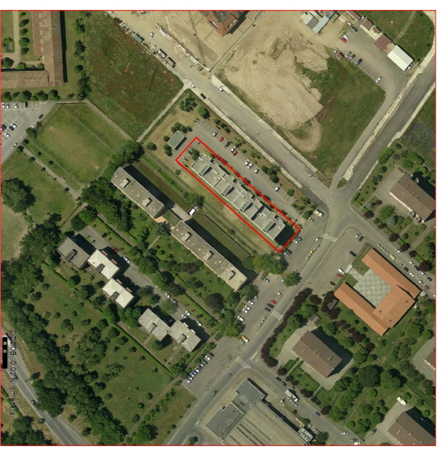
ORTOFOTO Individuazione dell'ambito di intervento