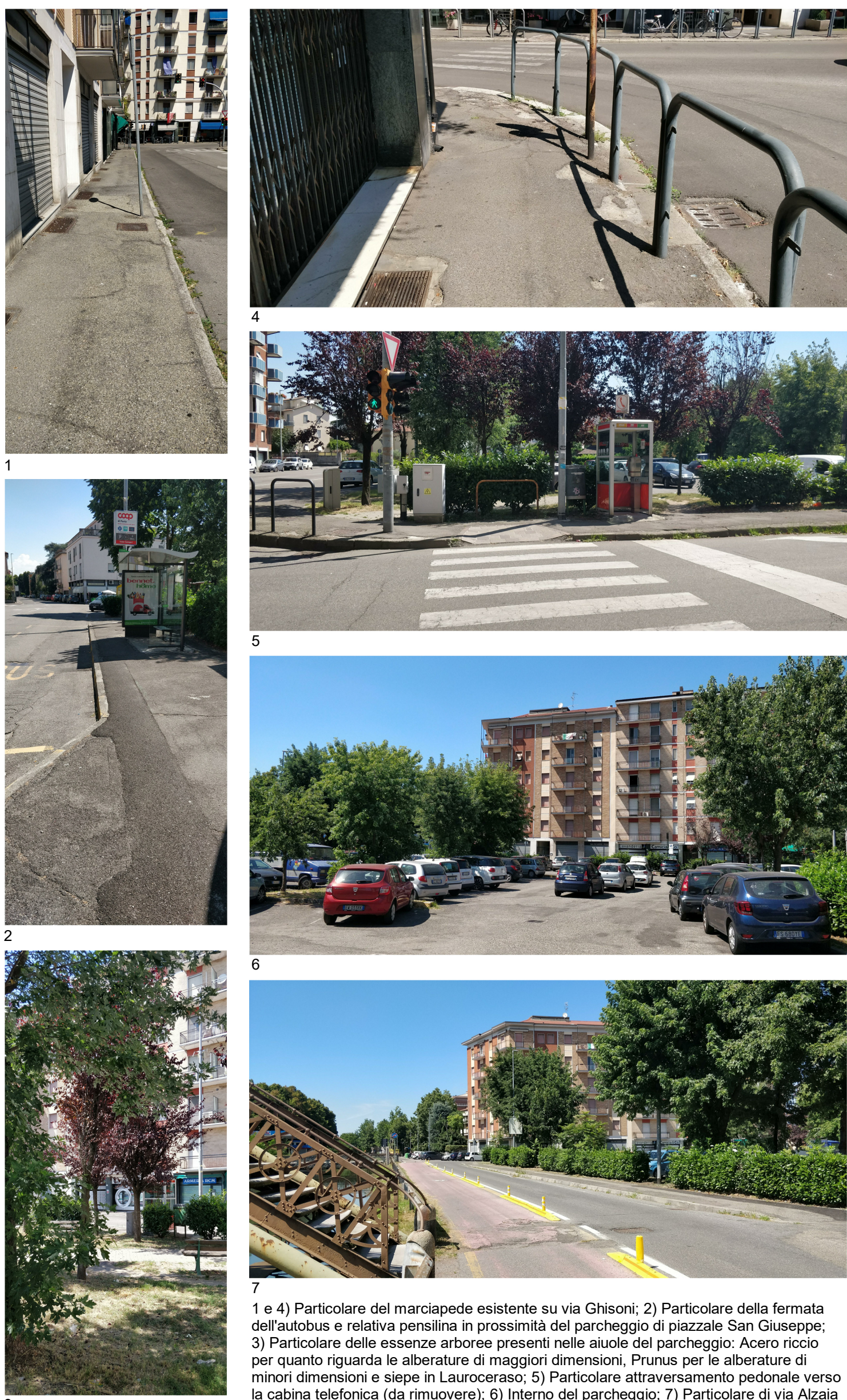
1 e 4) Particolare del marciapiede esistente su via Ghisoni; 2) Particolare della fermata dell'autobus e relativa pensilina in prossimità del parcheggio di piazzale San Giuseppe; 3) Particolare delle essenze arboree presenti nelle aiuole del parcheggio; Acero riccio per quanto riguarda le alberature di maggiori dimensioni, Prunus per le alberature di minori dimensioni e siepe in Laurocerasus; 5) Particolare attraversamento pedonale verso la cabina telefonica (da rimuovere); 6) Interno del parcheggio; 7) Particolare di via Alzania