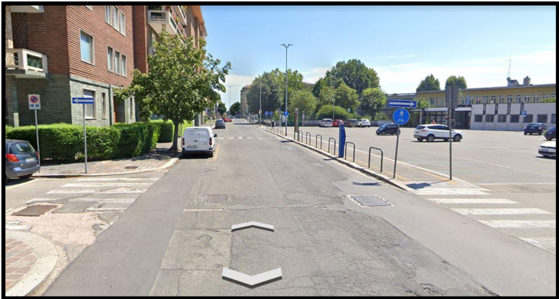
Viale Ambrogio Necchi (Google Earth)