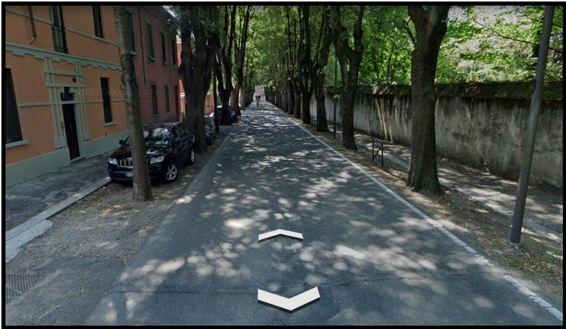
Viale Gorizia