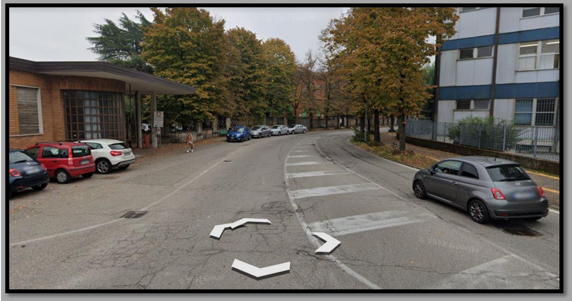
Viale Torquato Taramelli