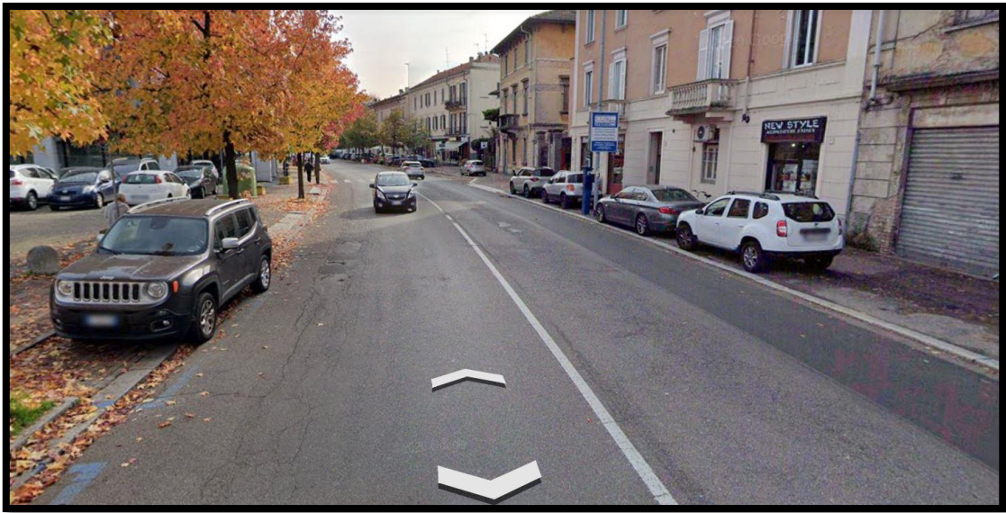
Viale Indipendenza (Google Earth)