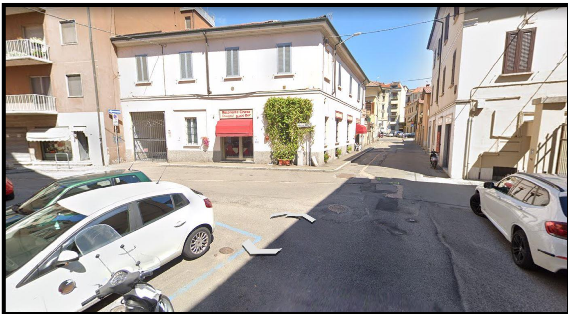
Via Folla di Sotto