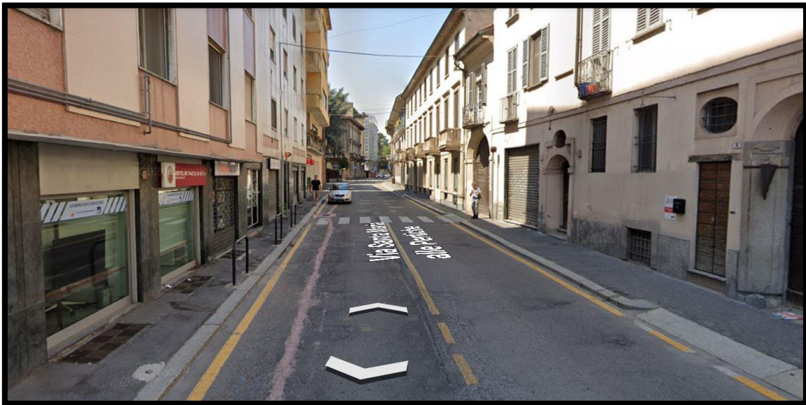
Via Santa Maria alle Pertiche