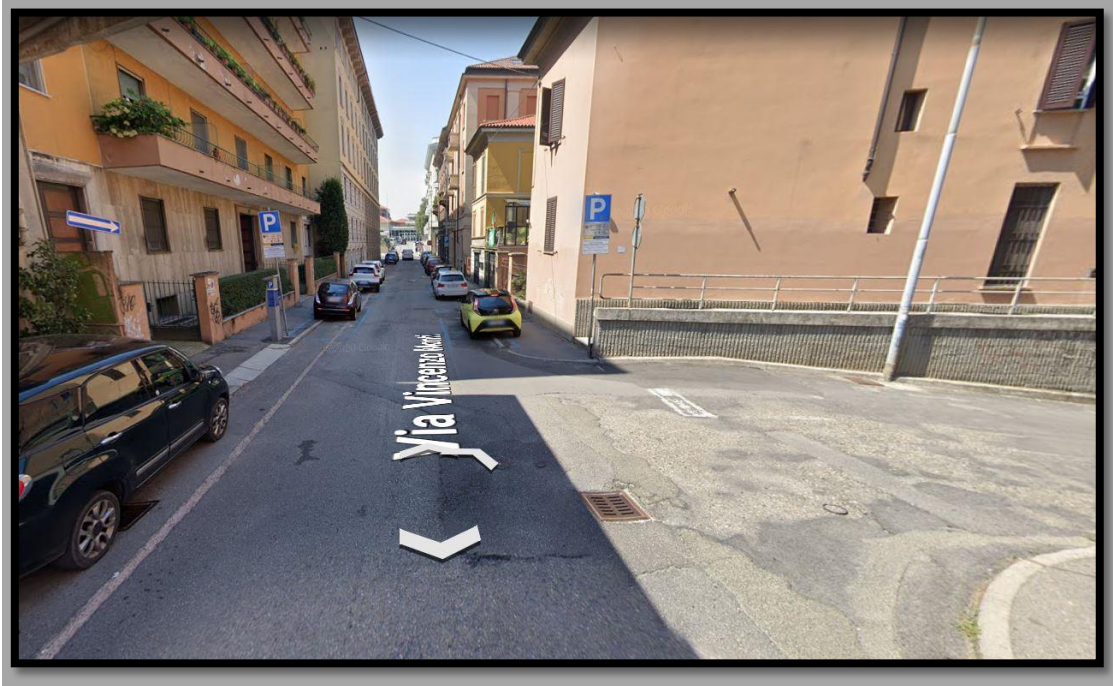
Via Vincenzo Monti