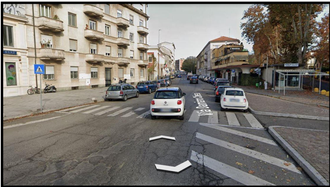
Viale Damiano Chiesa