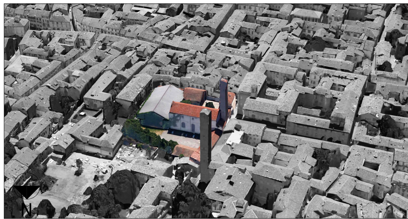
Vista aerea Nord