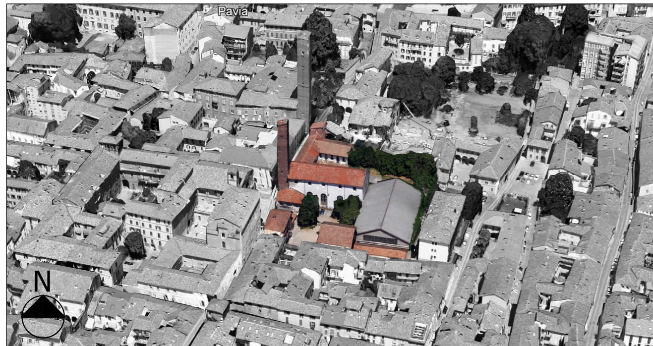
Vista aerea Sud