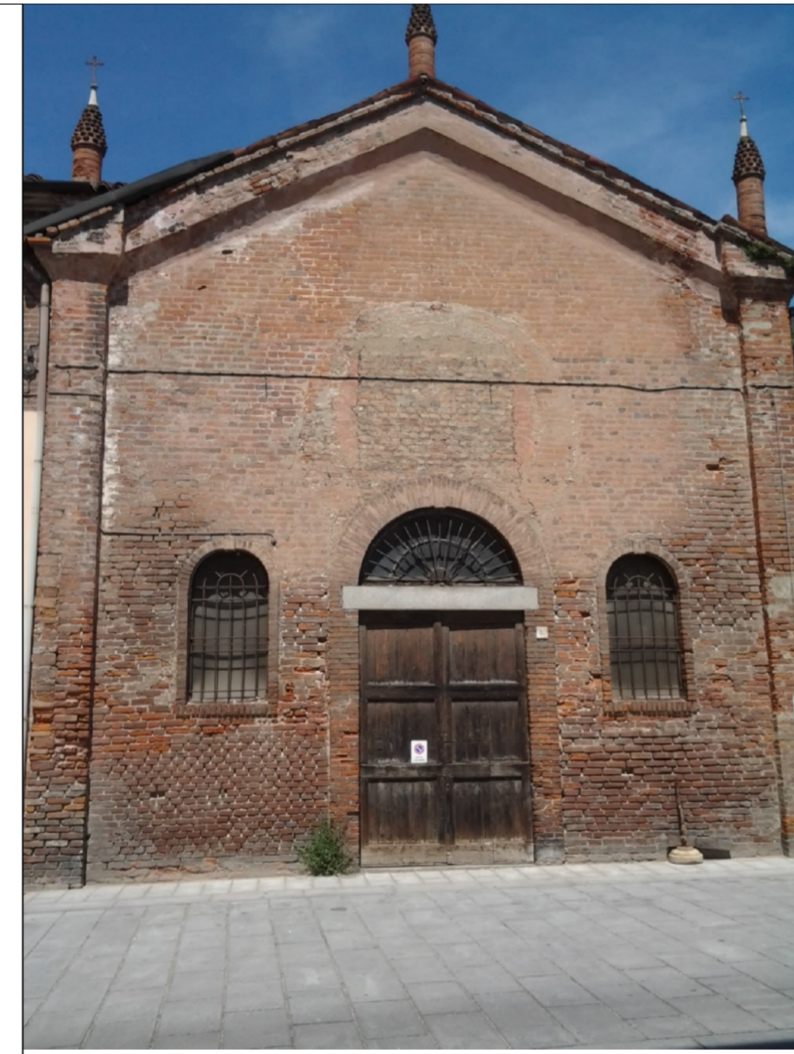
FACCIATA CHIESA DA RESTAURARE