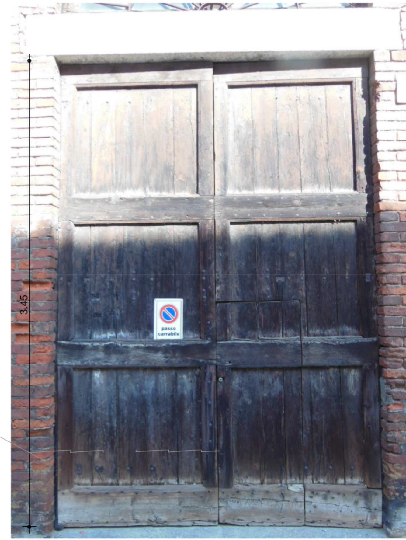
A PORTONE IN LEGNO DA RESTAURARE