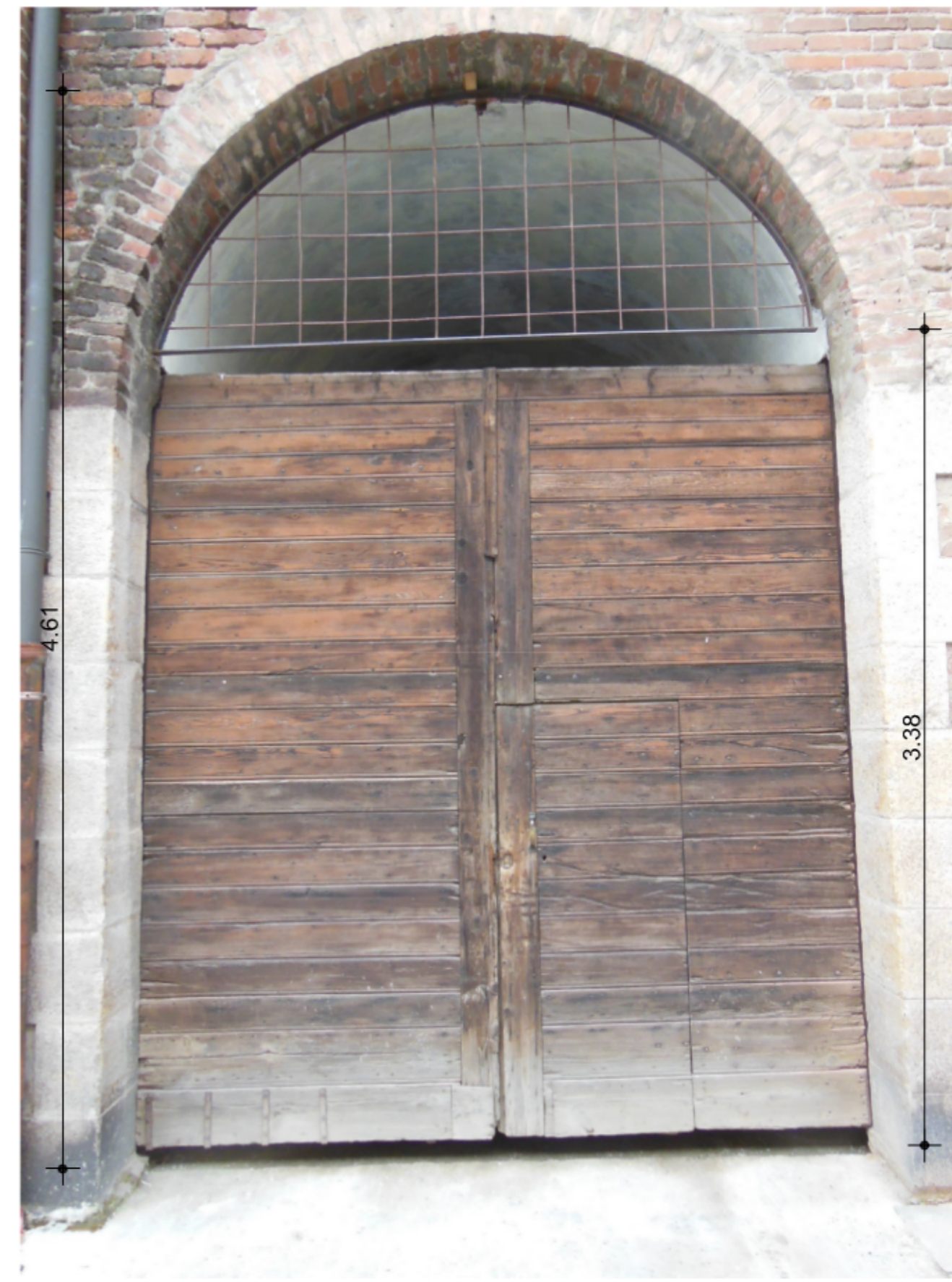
B PORTONE IN LEGNO ANDRONE DA RICOSTRUIRE