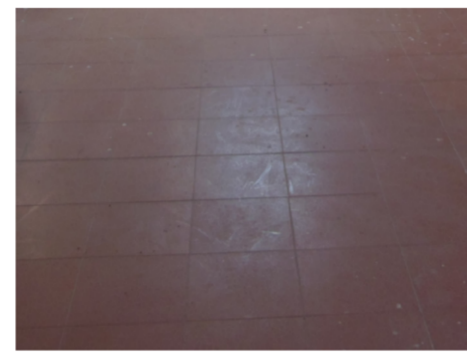
PAVIMENTO IN COTTO Piastrelle 30x30 tinta come esistente posate a griglia 90°