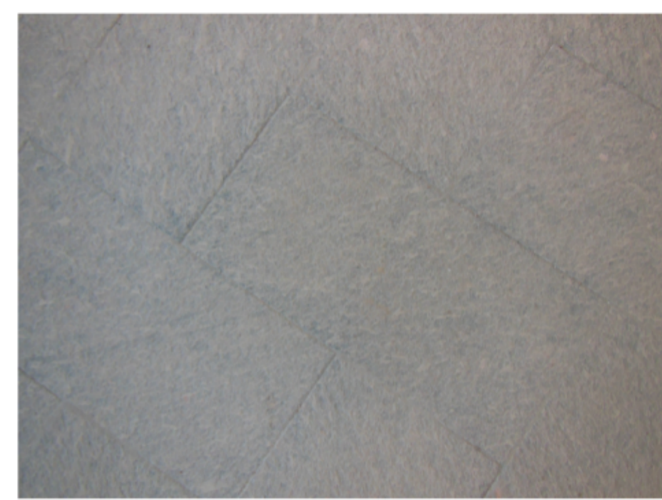
PAVIMENTO IN PIETRA Beola grigia (come esistente) in lastre 80x40x3 cm posate spina di pesce faccia a vista bocciardata (o fiammata o lucidata)