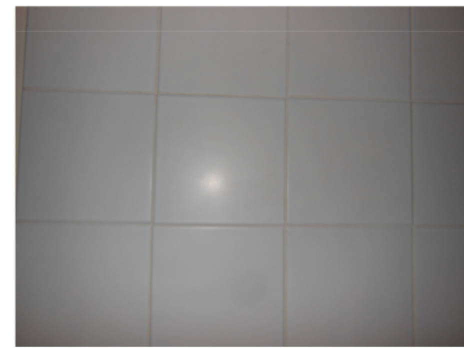
RIVESTIMENTO IN GRES PORCELLANATO Piastrelle 30x30 colore bianco come esistenti