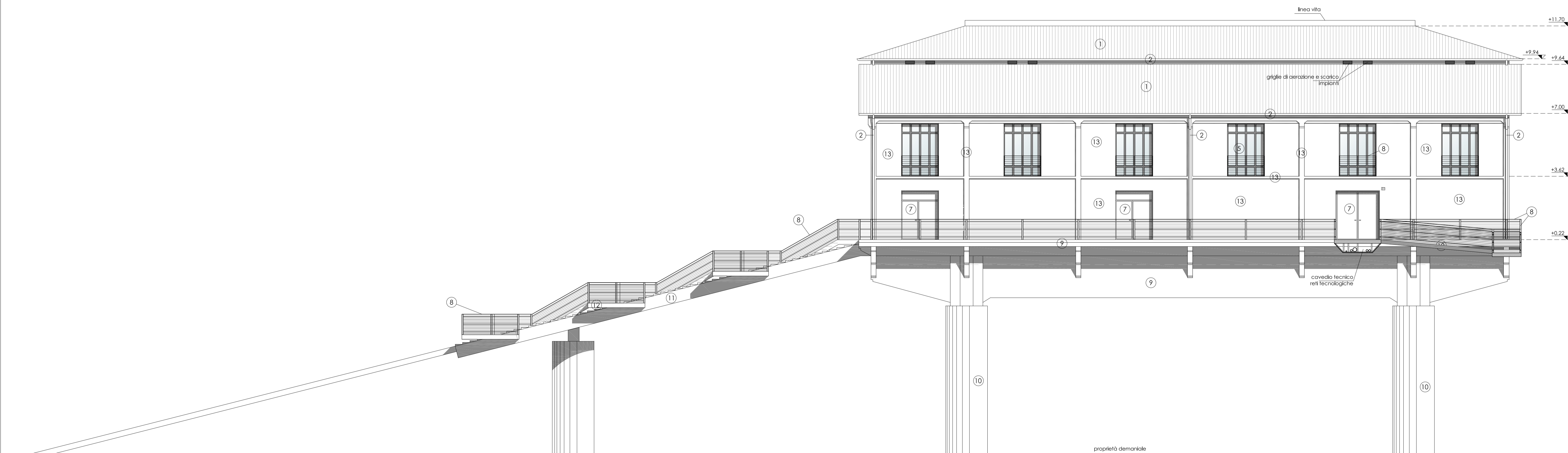
PROSPETTO NORD-EST scala 1:100