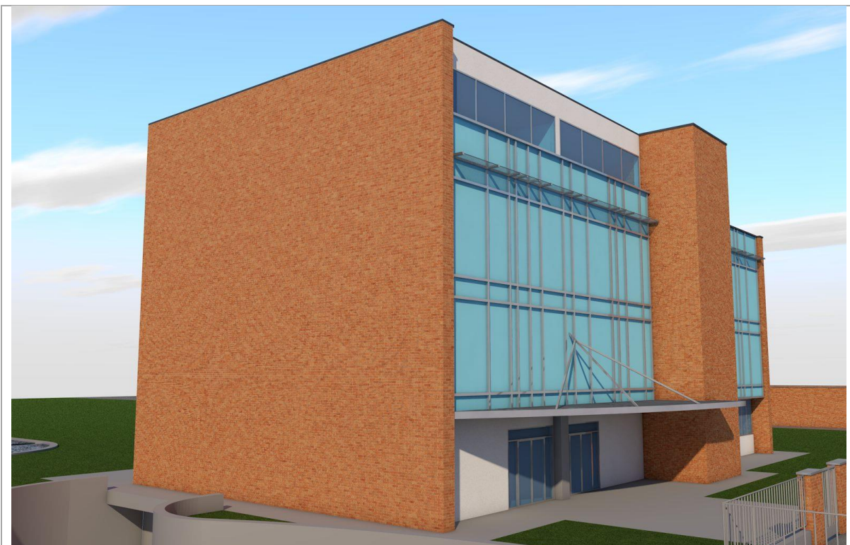
Render del progetto – Vista lato Nord-Ovest