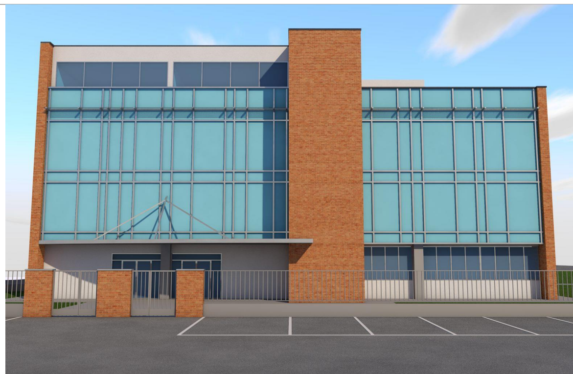
Render del progetto – Vista lato Ovest